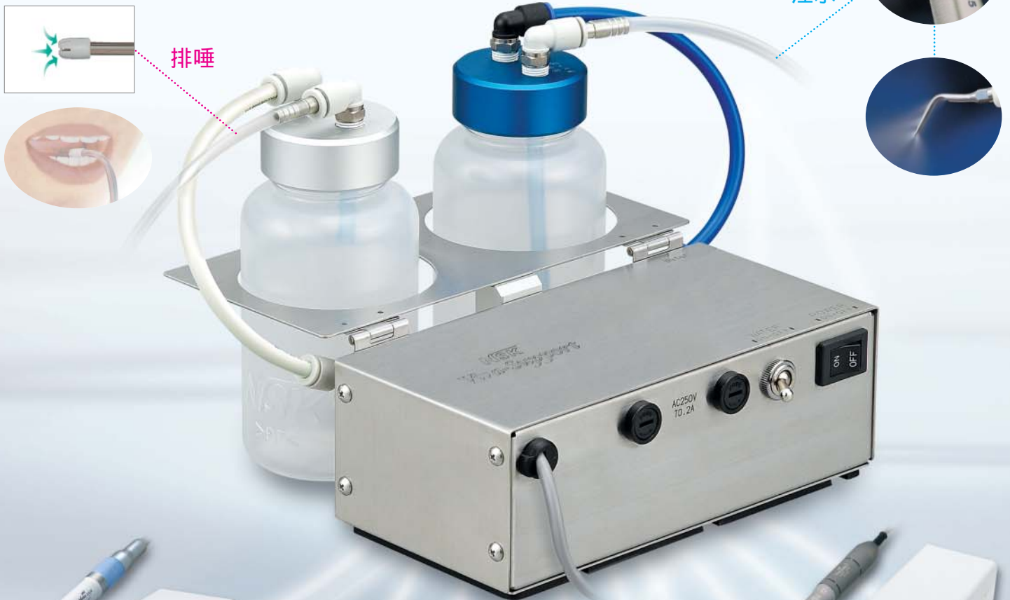
超ミニタイプ マルチタスク超音波システム バリオス350 LUX