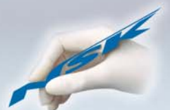
バッテリー/AC電源両用タイプ 携帯マイクロモーター ビバメイト プラス