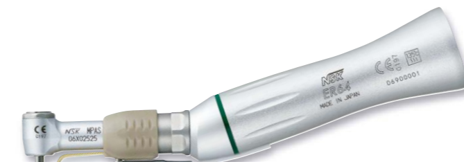
製品名 MPAS-ER64 製品番号 Y110146 標準価格 ¥86,000

販売名: エンド用コントラ MPA 一般的名称: ストレート・ギアードアングルハンドピース 医療機器承認番号: 22200BZ00180000号 管理医療機器 特定保守管理医療機器