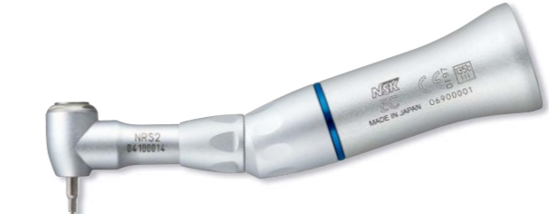
製品名 NRS2-EC 製品番号 Y110163 標準価格 ¥30,000