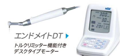
エンドメイトDT トルクリミッター機能付き デスクタイプモーター

ニッケルチタンファイルをご使用になる場合は、トルクリミッター機能が必要になる場合があります。破折トラブルを回避するため、トルクリミッター機能を搭載した商品をご用意しております。