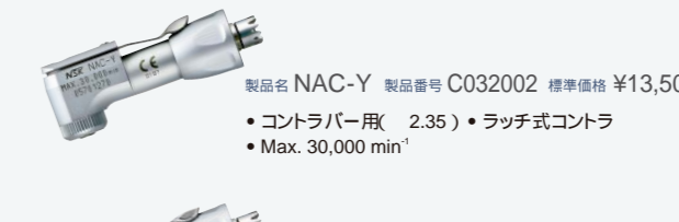
製品名 NAC-Y 製品番号 C032002 標準価格 ¥13,500 ・コントラバー用( 2.35 ) ・ラッチ式コントラ ・Max. 30,000 min -1