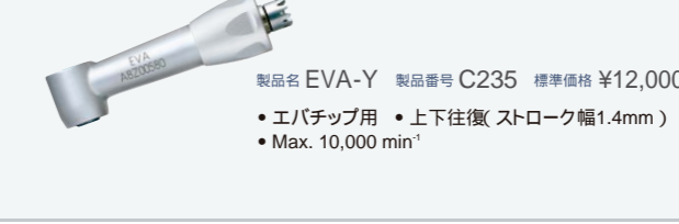
製品名 EVA-Y 製品番号 C235 標準価格 ¥12,000 ・エバチップ用 ・上下往復(ストローク幅1.4mm) ・Max. 10,000 min -1