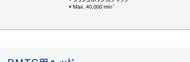
製品名 FFB-Y 製品番号 C884 標準価格 ¥25,500 ・FGバー用( 1.6 ) ・クリーンヘッドシステム ・プッシュボタン式チャック ・Max. 40,000 min -1