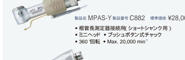
製品名 MPAS-Y 製品番号 C882 標準価格 ¥28,000 ・根管長測定器接続用(ショートシャック用) ・ミニヘッド ・プッシュボタン式チャック ・360 回転 ・Max. 20,000 min -1