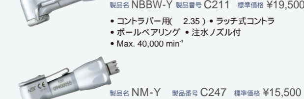
製品名 NBBW-Y 製品番号 C211 標準価格 ¥19,500 ・コントラバー用( 2.35 ) ・ラッチ式コントラ ・ボールベアリング ・注水ノズル付 ・Max. 40,000 min -1