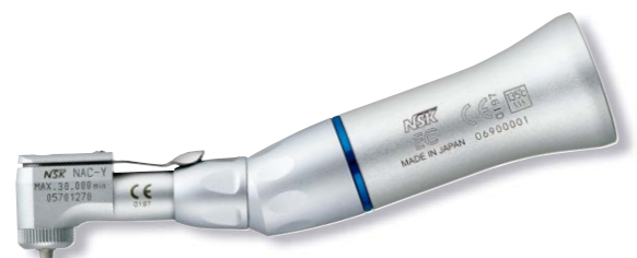
製品名 NAC-EC 製品番号 Y110148 標準価格 ¥24,000

販売名: コトラアングルハンドピース EXシリーズ 一般的名称: ストレート・ギアードアングルハンドピース 医療機器承認番号: 219ALBZ00006000号 管理医療機器 特定保守管理医療機器