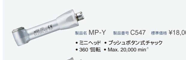
製品名 MP-Y 製品番号 C547 標準価格 ¥18,000 ・ミニヘッド ・プッシュボタン式チャック ・360 回転 ・Max. 20,000 min -1