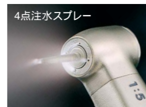
製品名 TI95EX 製品番号 C487 標準価格 ¥80,000