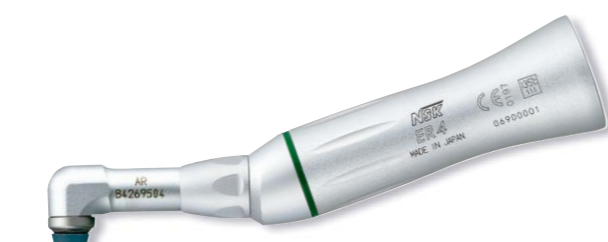
製品名 AR-ER4(S) 製品番号 Y110140 標準価格 ¥48,000