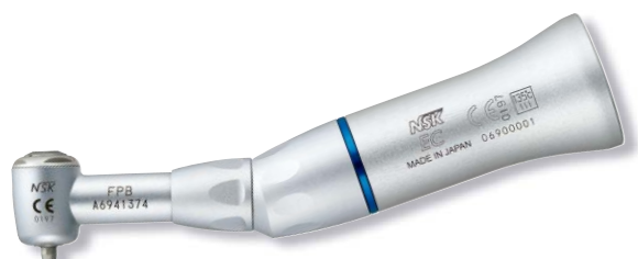
製品名 FPB-EC 製品番号 Y110158 標準価格 ¥36,000