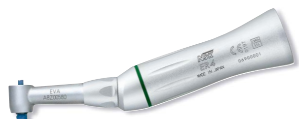
製品名 EVA-ER4 製品番号 Y110141 標準価格 ¥48,000

販売名: NSK プロファイ EVA 一般的名称: ストレート・ギアードアングルハンドピース 医療機器承認番号: 20200BZ00180000号 管理医療機器 特定保守管理医療機器