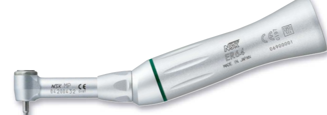
製品名 MP-ER64 製品番号 Y110142 標準価格 ¥76,000