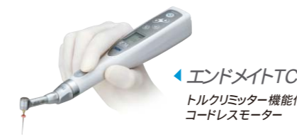
エンドメイトTC2 トルクリミッター機能付き コードレスモーター

上記は該当のヘッドとシャンクを組み合わせた場合における先端(ファイル)の速度を表わしています。