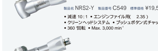
製品名 NRS2-Y 製品番号 C549 標準価格 ¥19,500 ・減速 10:1 ・エンジンファイル用( 2.35 ) ・クリーンヘッドシステム ・プッシュボタン式チャック ・360 回転 ・Max. 3,000 min -1