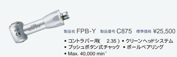
製品名 FPB-Y 製品番号 C875 標準価格 ¥25,500 ・コントラバー用( 2.35 ) ・クリーンヘッドシステム ・プッシュボタン式チャック ・ボールベアリング ・Max. 40,000 min -1