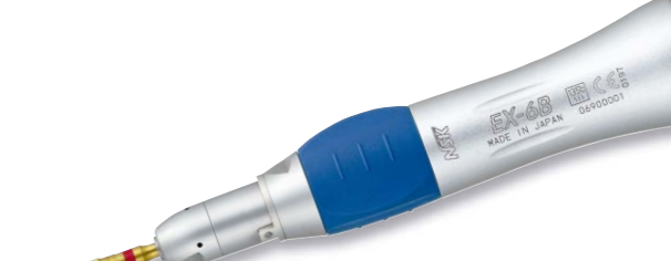
製品名 EX-6B 製品番号 H260 標準価格 ¥30,000