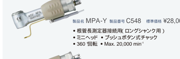
製品名 MPA-Y 製品番号 C548 標準価格 ¥28,000 ・根管長測定器接続用(ロングシャック用) ・ミニヘッド ・プッシュボタン式チャック ・360 回転 ・Max. 20,000 min -1