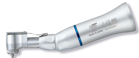
製品名 BB-EC 製品番号 Y110159 標準価格 ¥26,000