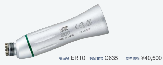
製品名 ER10 製品番号 C635 標準価格 ¥40,500 ・減速 10:1 ・Max. 40,000 min -1