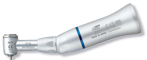
製品名 FFB-EC 製品番号 Y110162 標準価格 ¥36,000

販売名: コトラアングルハンドピース EXシリーズ 一般的名称: ストレート・ギアードアングルハンドピース 医療機器承認番号: 219ALBZ00006000号 管理医療機器 特定保守管理医療機器