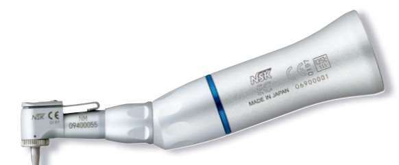
製品名 NM-EC 製品番号 Y110161 標準価格 ¥26,000

販売名: コトラアングルハンドピース EXシリーズ 一般的名称: ストレート・ギアードアングルハンドピース 医療機器承認番号: 219ALBZ00006000号 管理医療機器 特定保守管理医療機器