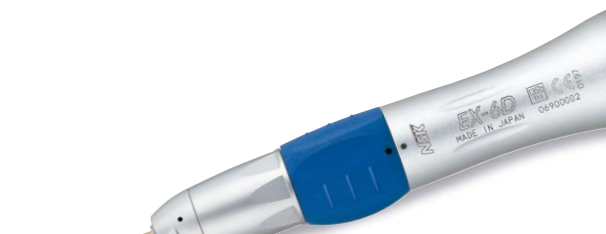
製品名 EX-6D 製品番号 H267 標準価格 ¥30,000

販売名: ストレートハンドピース EX6 一般的名称: ストレート・ギアードアングルハンドピース 医療機器承認番号: 219ALBZ00002000号 管理医療機器 特定保守管理医療機器