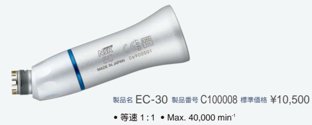
製品名 EC-30 製品番号 C100008 標準価格 ¥10,500 ・等速 1:1 ・Max. 40,000 min -1