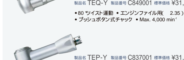
製品名 TEQ-Y 製品番号 C849001 標準価格 ¥31,500 ・80 ツイスト運動 ・エンジンファイル用( 2.35 ) ・プッシュボタン式チャック ・Max. 4,000 min -1