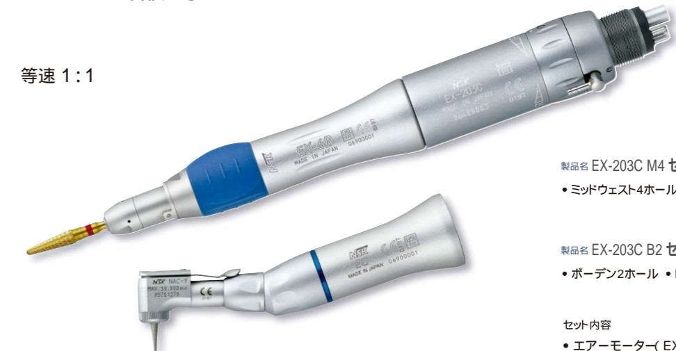
製品名 EX-203C M4 セット 製品番号 Y160020 標準価格 ¥128,000