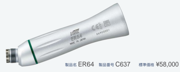
製品名 ER64 製品番号 C637 標準価格 ¥58,000 ・減速 64:1 ・Max. 40,000 min -1

リングカラー 減速比ごとにカラーが 異なります。事前に 確認ください。 ● レッド : 増速 ● ブルー : 等速 ● グリーン : 減速