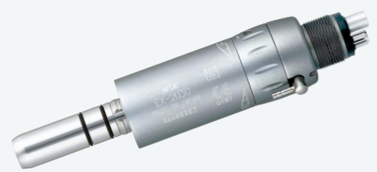
製品名 EX-203C M4 製品番号 M195 標準価格 ¥76,000 ・等速 1:1 ・ミッドウェスト4ホール ・Max. 20,000 min -1 ・適正エア圧: 0.25MPa