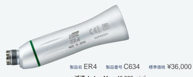
製品名 ER4 製品番号 C634 標準価格 ¥36,000 ・減速 4:1 ・Max. 40,000 min -1