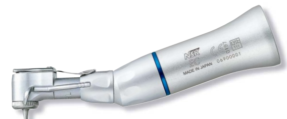
製品名 NBBW-EC 製品番号 Y110160 標準価格 ¥30,000

販売名: コトラアングルハンドピース EXシリーズ 一般的名称: ストレート・ギアードアングルハンドピース 医療機器承認番号: 219ALBZ00006000号 管理医療機器 特定保守管理医療機器