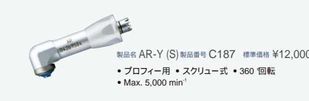
製品名 AR-(S) 製品番号 C187 標準価格 ¥12,000 ・プロフィー用 ・スクリュー式 ・360 回転 ・Max. 5,000 min -1