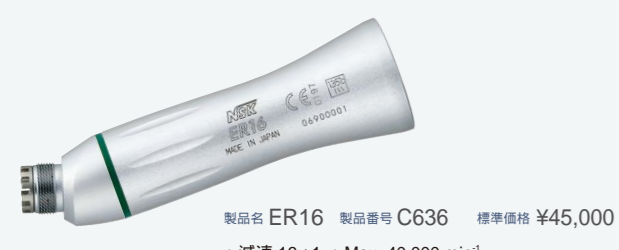
製品名 ER16 製品番号 C636 標準価格 ¥45,000 ・減速 16:1 ・Max. 40,000 min -1