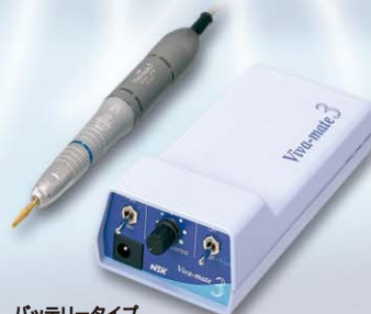
バッテリータイプ 携帯マイクロモーター ビバメイト 3