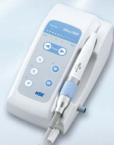
コンパクトタイプ マルチタスク超音波システム バリ奥斯560 LUX