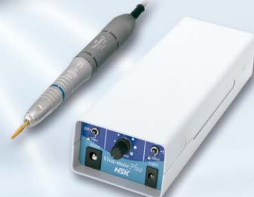
バッテリー/AC電源両用タイプ 携帯マイクロモーター ビバメイト プラス