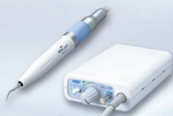
超ミニタイプ マルチタスク超音波システム バリ奥斯350 LUX