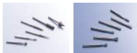
電着ダイヤモンド